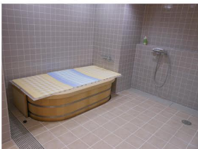
青森ひば小判型浴槽