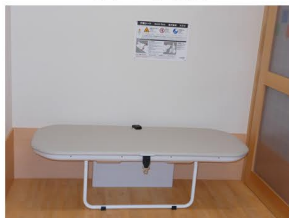
ユニバーサルシート