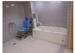
機械浴スプロール